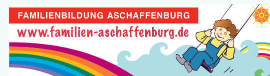
Illustration und Gestaltung: Elvira Roupp Klimaneutral gedruckt; 2024